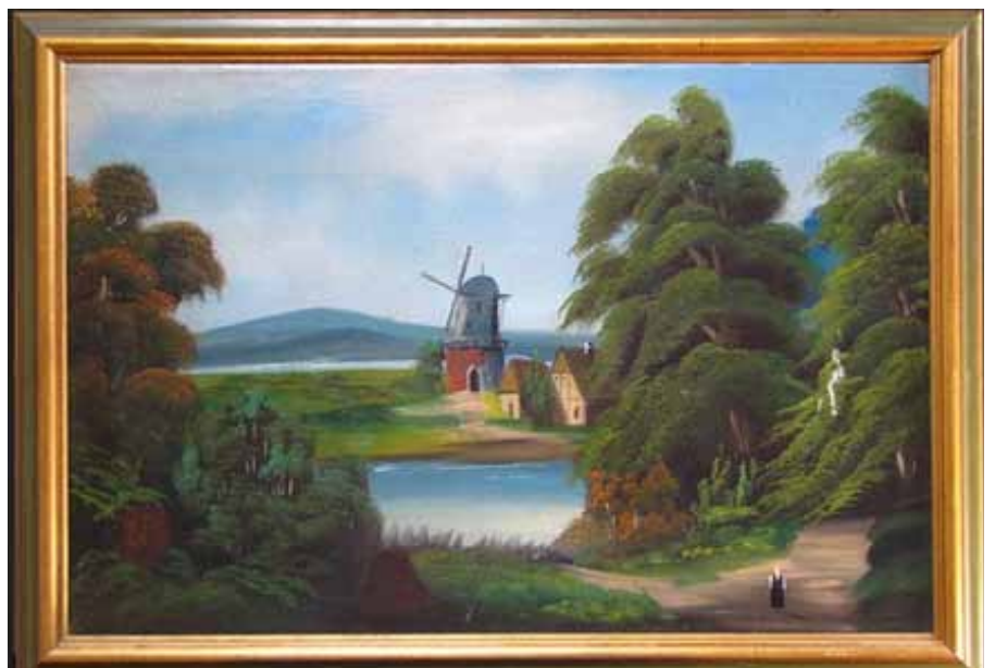
Öl auf Leinwand. 70 x 50 cm. Mühlenlandschaft gegen Sommerende.

Windmühlen. Ölgemälde erinnert an früher. Je moderner unser Leben, desto mehr fasziniert die Energiegewinnung von früher. Windmühlen sind nicht nur technisch großartige Bauwerke, auch die heute mitschwingende Romantik lässt das damals harte Leben des Mühlenbauers vergessen. Hier scheint ein Sonntagnachmittag der Müllerin etwas Zeit für einen Spaziergang gelassen zu haben. Öl auf Leinwand, Format ca. 70 x 50 cm, klassischer Holzrahmen farblich passend, Preis EUR 280,-.