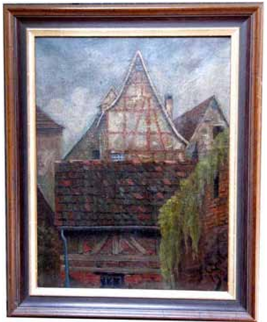
Fachwerk-Idylle in Süddeutschland. Öl auf Leinwand, mit R, 50 x 60 cm

Stimmungsvolle, alte dörfliche Fachwerkbauweise, räumlich beengt - vermutlich aus Baden-Württemberg. Der spitze Giebel des Fachwerks erinnert ein wenig an die Zeit um Albrecht Dürer. Schwäbische Dorf-Idylle von kundiger Hand in Öl auf Leinwand festgehalten, passend neu gerahmt in harmonischer Farbgebung. Ideal für Essplatz oder Diele, Lesezimmer oder Bibliothek. Eine zeitlos charmante Rarität. Preis EUR 340,-.