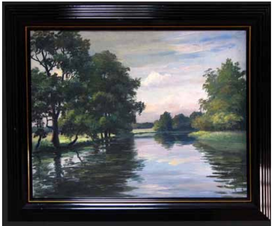
Öl auf Leinwand. 60 x 50 cm. Abendliche Stimmung am Dorfweiher

Abendstimmung als Öl-Gemälde. See oder Fluss? Auf jeden Fall herrliche Ruhe mit sanfter Abendstimmung. Vermutlich entstanden im Umland von Berlin. Öl auf Leinwand, gerahmt. Format ca. 60 x 50 cm. Elegant profilierter Rahmen, passend zu modernen wie klassischen Einrichtungen. Preis EUR 240,-.