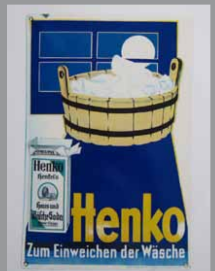
Die Drucke werden ohne Rahmen einzeln oder als ganze Sammlung abgegeben. Die Blattgröße beträgt ca. 34 x 50 cm. Der Stückpreis liegt bei 55,- EUR, über die Gesamtabnahme kann nach Motiveinsicht gern verhandelt werden. Rechnungsstellung mit MWSt. ist möglich.