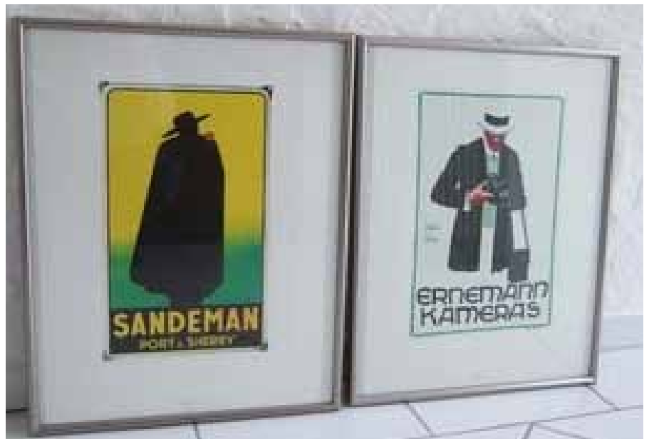
Aus der Edition Grosser Marken. Siebdrucke von Werbe-Klassikern aus der Reklame-Zeit. Blattgröße 34 x 50 cm.

Von der renommierten Siebdruckerei Domberger, Filderstadt, gab es vor ca. 15 bis 20 Jahren eine Grafik-Serie (Edition großer Marken, Michael Domberger) von seltenen Email-Werbeschildern. Erstellt aus Vorlagen einer privaten Sammlung, gedruckt in hochwertigem ca. 10-farbigem Siebdruck. Motive, die jeden Marketing- oder Werbefachmann berühren und begeistern. Ideal für Chefbüros, Empfangsbereiche, Besucherzimmer oder Präsentationsräume.